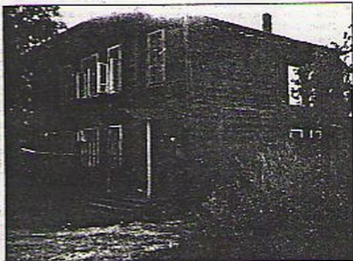
На снимке: Дом Г.Гребенщикова в Барнауле.

ливаются во Франции. Здесь Гребенщиков встречается с И.Буниным с Н.Рерихом. Последний предлагает ему возглавить русское книгоиздательство «Алтае» при музее Рериха в Нью-Йорке.