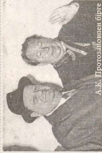
А.К. Протозановпен бірге