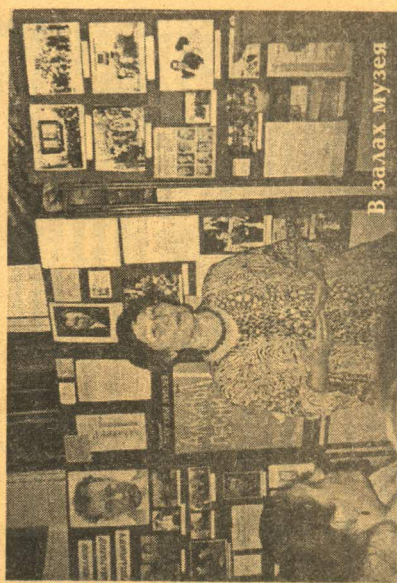
В залах музея