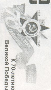
К 70-летию Великой Победы

После торжественного приема в нашем районе, в этот же день, символ эстафеты - боевое знамя 72-й Гвардейской стрелковой дивизии, проследовал в Семей. Впереди еще два торжественных момента передачи в Курчатове и Павлодаре, а затем стая вернется в Астану.