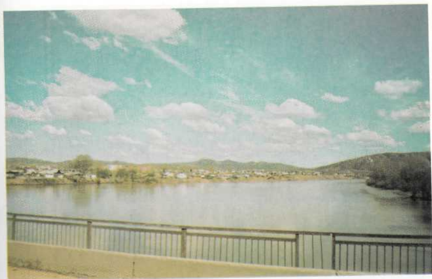
г. Шемонаиха, 2003 г.